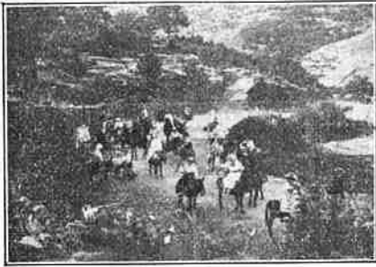
Baños de Montemayor.— Excursión de bañistas á los alrededores.

Temporada oficial: desde el 1.º de Junio al 30 de Septiembre.