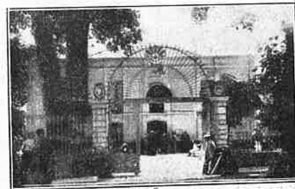
Baños de Montemayor. Puerta del establecimiento balneario.