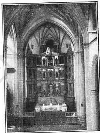
Plasencia.—Iglesia del Convento de Santo Domingo.