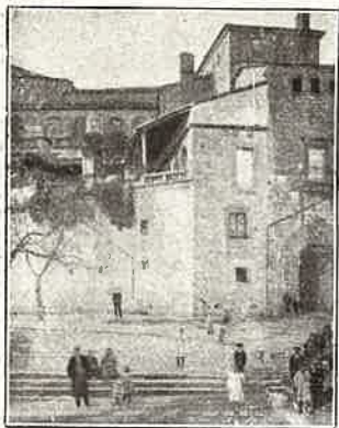
Plasencia.—Palacio de los Marqueses de Mirabel.

de adornos de estilo algo plateresco. En el crucero N. se halla la hermosa puerta conocida con el nombre de Puerta del Enlosado , que ostenta los