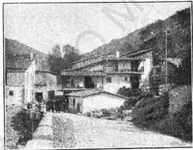
Baños de Montemayor.— Entrada del pueblo.

En una palabra; el balneario de Baños de Montemayor está dotado de todos los medios hidroterápicos necesarios para la aplica-