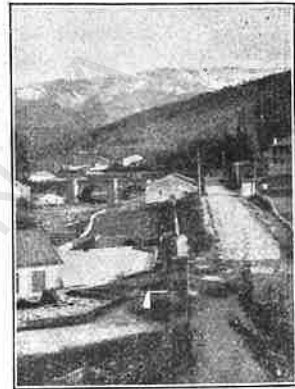
Béjar.— Camino de Candelario.

rodeada de hermosísimos jardines, y el segundo, que sirve hoy de cuartel de infantería, está en el casco de la población. Hay importantes y numerosas fábricas de paños, que constituyen uno de sus principales medios de vida; digna de ser visitada es también la Escuela de Industrias, dotada de excelente material de enseñanza práctica. En cuanto á la topografía de Béjar, dejemos la palabra al eminente é inmortal poeta Gabriel y Galán, que la describe de este modo: