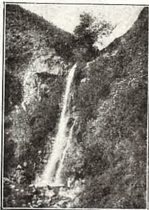
Hervás.— La Chorrera grande.

sus productos perfectos. Más arriba hállanse las enormes Chorreras , que son dos hermosas cascadas que caen en caprichosos saltos desde alturas de 60 y 30 metros, respectivamente; están situadas á 1.400 metros sobre el nivel del mar, y en sus frescas aguas vive la rica trucha de esta región.