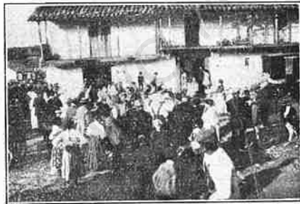
Peñacaballera.— Llegada de excursionistas á la plaza.

La Muy Noble y Muy Leal ciudad de Béjar, perteneciente á la provincia de Salamanca, consta de 9.500 habitantes y está bañada por el río llamado Cuerpo de Hombre. Ejerció notoria influencia durante las dominaciones romana y goda en la Lusitania, á la que perteneció. Sabido es que las poblaciones que gozaban del privilegio de ser conventos jurídicos , ó sea capital de asambleas provinciales , eran de las más distinguidas y ri-