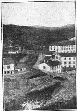
Béjar.—Fábricas de paños á orillas del río Cuerpo de Hombre.

Esta lindísima ciudad, á la que su fundador denominó Ut Deo Placeat , de donde, sin duda, proviene su nombre actual, corona una altura cuya base está bañada en sus tres cuartas partes por el río Jerte, que, bajo cuatro puentes antiguos y uno moderno (1902), desliza sus cristalinas aguas por entre profundas gargantas, dándole el as-