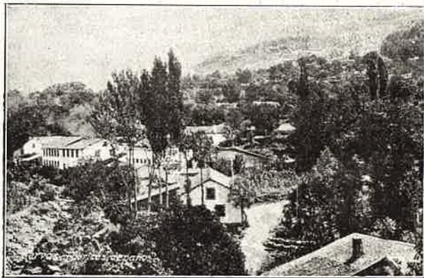
Hervás.— Fábrica de paños.

En aprovechamiento de los saltos que se citan hay una fábrica de electricidad, que da luz á los pueblos de Hervás, Baños de Montemayor, Garganta de Baños, Aldeanueva, Abadía, Granja, Zarza y varios case- ríos.