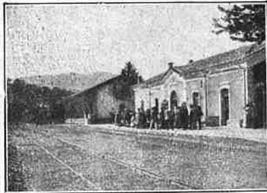
Baños de Montemayor. La estación del ferrocarril.

En el fondo de un risueño valle, formado por derivaciones de la sierra Carpeto-Vetónica, ó de Guadarrama, y en el límite de la provincia de Cáceres con la de Salamanca, está enclavado Baños de Montemayor , que el