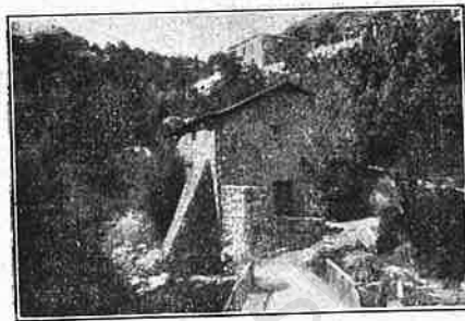
Baños de Montemayor.— Un rincón del paisaje.

ción conveniente de sus aguas. En estos últimos años se han realizado costosas y notables mejoras, entre las que citaremos la construcción de un pabellón con doce gabinetes y otras tantas magníficas pilas de mármol blanco, un depósito enfriadero capaz para 2.700 metros cúbicos de agua, y otras obras hidráulicas de importancia que contribuyen á su embellecimiento. El manantial brota en una roca granítica, á cuatro metros de profundidad, aproximadamente, debajo y hacia el centro de la actual Sala de pulverizaciones, á razón de 130 litros por minuto y con una temperatura de 43°. El último análisis de estas aguas es el siguiente: