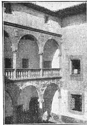
Béjar.— Pátio del Castillo de los Duques de Béjar.

Béjar tiene preciosos alrededores: la Peña de la Cruz y la Peña Negra, el paseo de Santa Ana y Fuente del Lobo, el ya mencionado Bosque, y muy particularmente el Castañar, del que también el poeta Gabriel y Galán, en sus hermosas quintillas, dice: