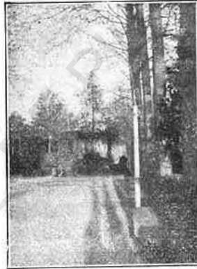
Béjar.— El Parque.

cas; Béjar fué una de éstas, según testimonio de Plinio. En su archivo municipal se conserva un Códice de sesenta y cuatro folios en cuarto, escrito en caracteres góticos del siglo XIV, donde están copiados los fueros de Béjar, con una nota que advierte que éstos fueron otorgados el año 1211. Posee unas antiguas y desmanteladas murallas, además del castillo y palacio de los Duques de Béjar; el primero sito en la gran propiedad llamada «El Bosque»,