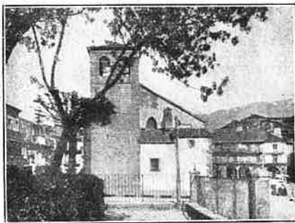
Béjar.—Plaza de Maldonado y entrada de la calle Mayor.

Esta lindísima ciudad, á la que su fundador denominó Ut Deo Placeat , de donde, sin duda, proviene su nombre actual, corona una altura cuya base está bañada en sus tres cuartas partes por el río Jerte, que, bajo cuatro puentes antiguos y uno moderno (1902), desliza sus cristalinas aguas por entre profundas gargantas, dándole el as-