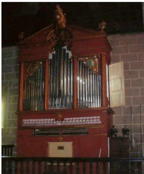
Órgano de Pasarón de la Vera