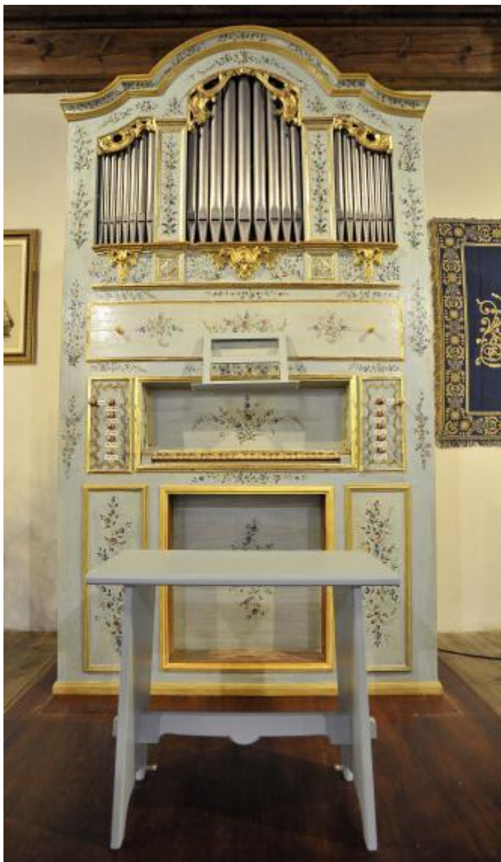
Órgano barroco de Guadalupe

cambio de liturgia que se dio a partir del Concilio Vaticano II -con la incorporación de las lenguas vernáculas y las melodía y ritmos autóctonos-, las condiciones atmosféricas, el paso del tiempo y la