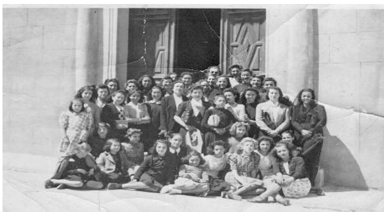
Fig. 9. Instituto Nacional de Bachillerato 'Gabriel y Galán', entre 1941 y 1942