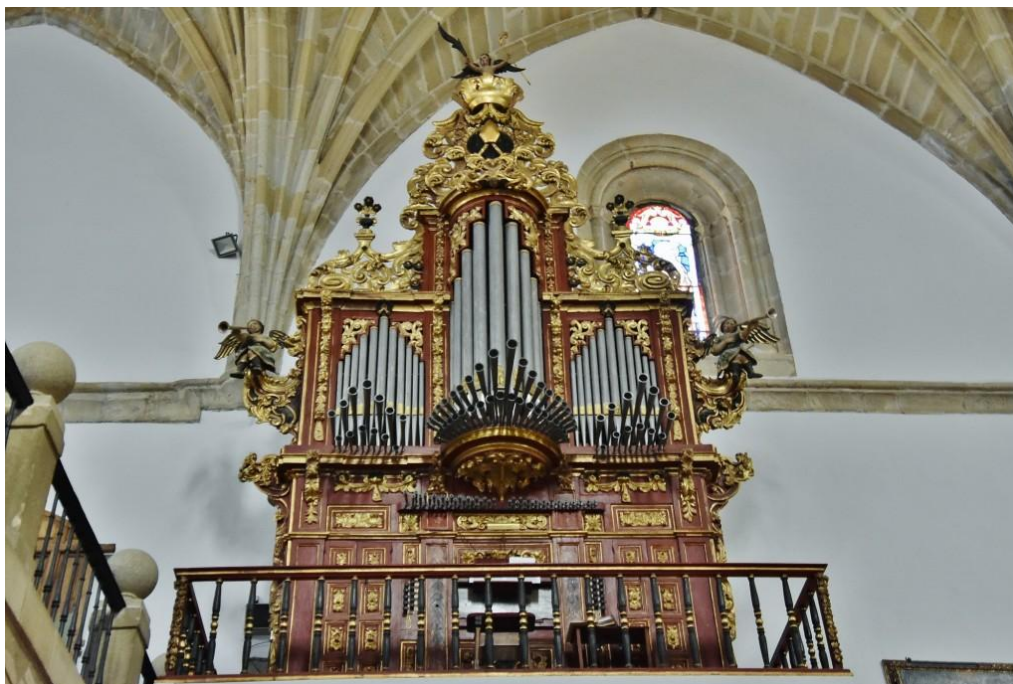
Órgano de la iglesia de San Martín de Trujillo