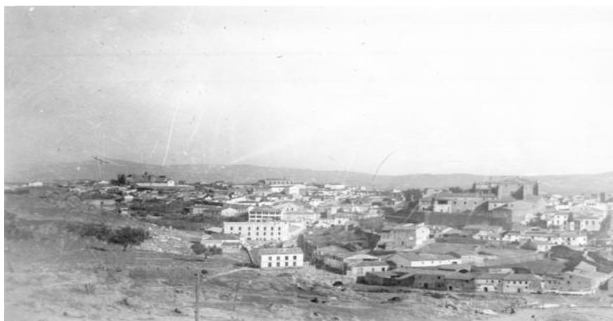
Fig. 8. Edificio en construcción del antiguo instituto en la calle Matías Montero, 1932-33